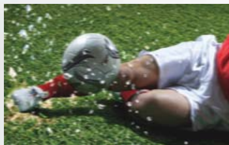
Tecnología exclusiva de Sony Motionflow 200Hz con reducción de borrosidad